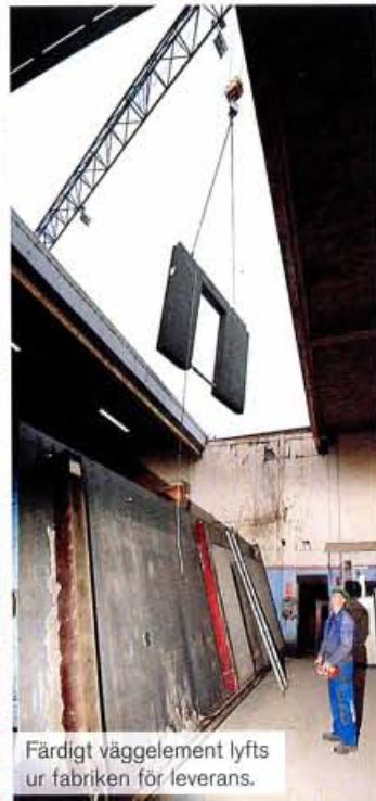
Färdigt väggelement lyfts ur fabriken för leverans.