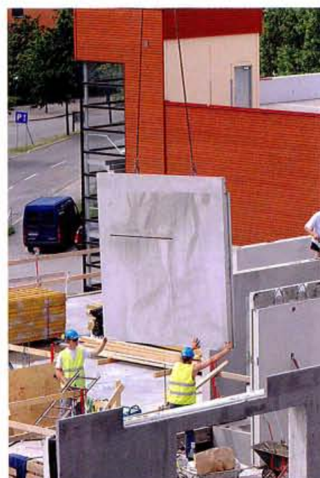
På väg mot elva våningar när Brf Masten byggs i Göteborg.

– Det är viktigt att hålla god ordning och hela tiden föra en dialog med alla som är involverade i projektet. Det här bygget är också lite speciellt med tanke på att det är elva våningar, det högsta vi genomfört. ●●●