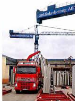
Lastning av väggar för leverans till kund.