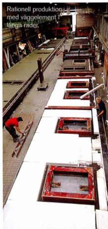
Rationell produktion med väggelement i långa rader.