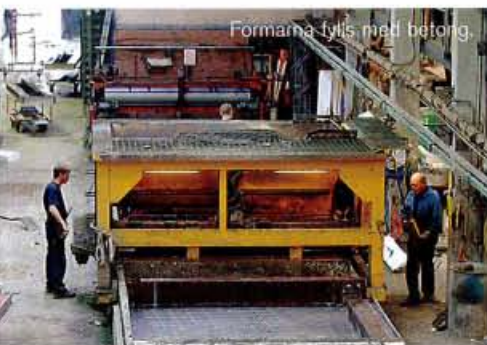
Formarna fylls med betong.

De tre arbetslagen i produktionen ser till att alla urtag för fönster, dörrar, VVS och el hamnar på rätt ställe i väggarna. Likaså gäller det att sätta armering exakt där den ska vara för rätt stabilitet. I eget snickeri byggs de formar som ritningarna föreskriver.