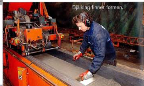
Bjälklag finner formen.