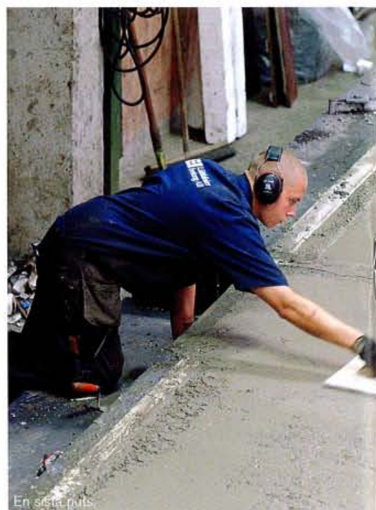
En sista puts.

HAN VET VAD han talar om efter snart 30 år inom företaget. Det innebär förstås lång erfarenhet och stora kunskaper. Han började som ritare en gång i tiden och har genom åren fått ta ett allt större ansvar för produktionen och allt vad som hör därtill.